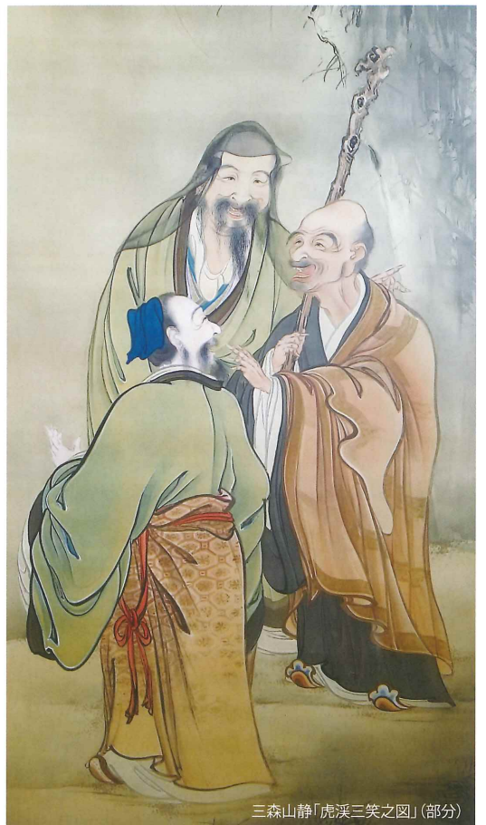
三森山静「虎溪三笑図」(部分)