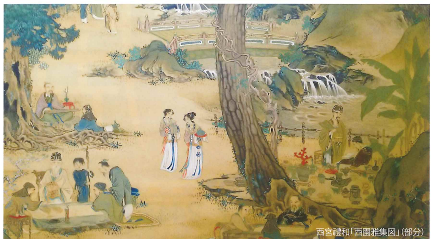
西宮禮和「西園雅集図」(部分)