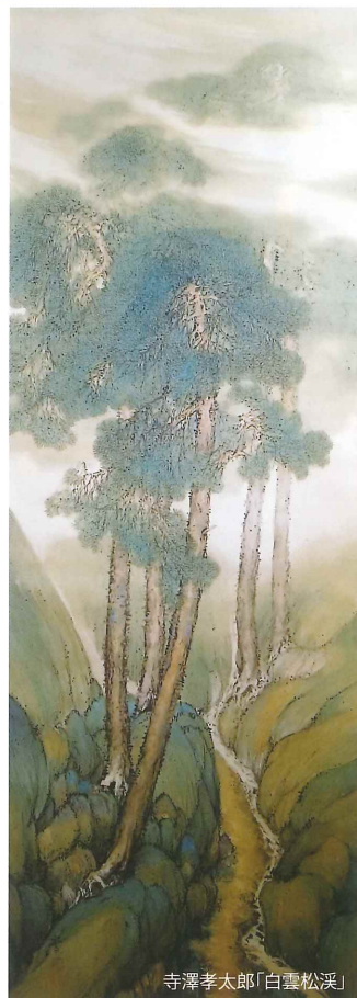
寺澤孝太郎「白雲松溪」